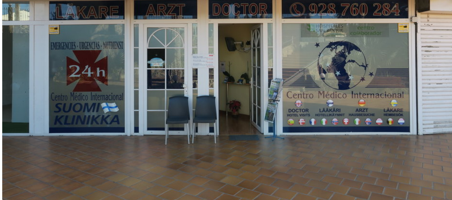
Terveys - Suomalainen Lääkäriasema Inglesissä