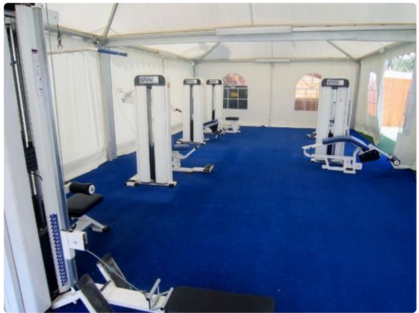
Asiakkaat saavat vapaasti käyttää Green Field -hotellin laajaa, lämmitettyä uima-allasaluetta auringonottoalueineen sekä saunan viereistä pienimuotoista kuntosalitilaa.