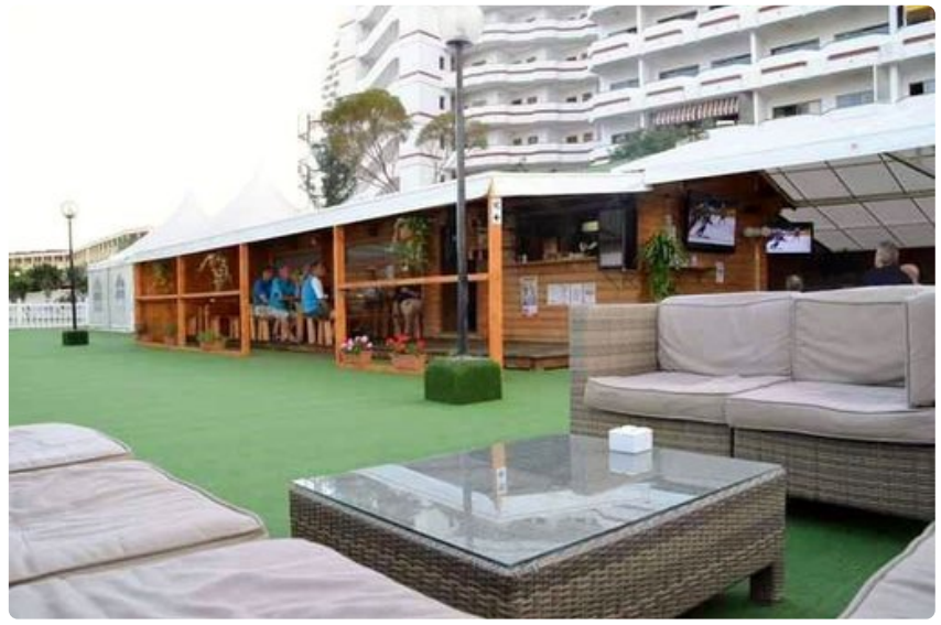
Kontulan Helmi -saunarakennus on rakennettu nilsiäisestä, suomalaisesta puusta ja täällä saat löylyt suomalaiseen makuun. Eli esimerkiksi joulusauna on taattu, vaikka ollaan tuhansien kilometrien päässä Suomesta.